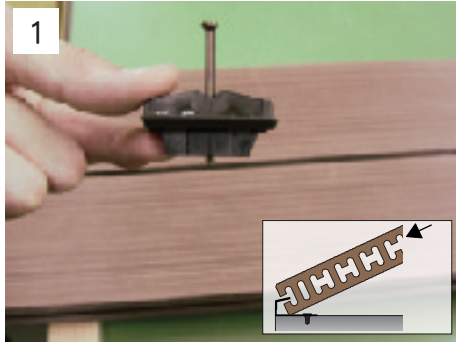
1 QCSを使用してランネルデッキを固定していきます。端部は端部固定金物を使用。