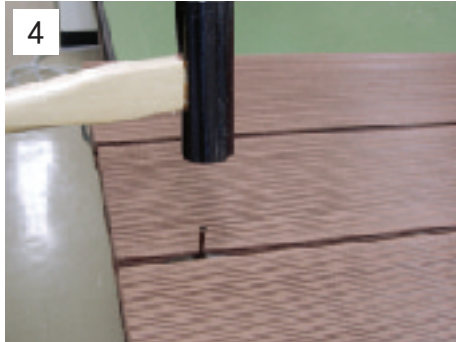
4 QCSのビスを仮止めします。(木根太の場合) 2~4を繰り返して、デッキ材を敷いていきます。