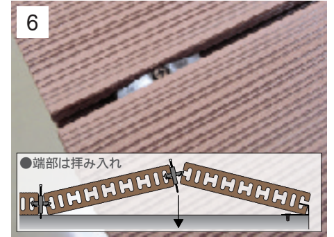
6 完成。デッキ面からビスの露出がなく、目地5mmが確保されます。