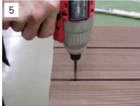
5 QCSのビスを本締めします。(2号ビット使用)